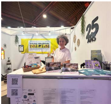
Avec notamment la participation de Comundo.