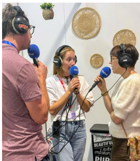
Emission du 29.09.2025 en direct de la Foire du Valais.

Valais Solidaire a bénéficié d'une visibilité renforcée grâce à des interventions mensuelles sur les ondes de la radio Rhône FM. Ces prises de parole ont permis de mettre en lumière les activités des organisations membres, de présenter leurs projets et de donner la parole à celles et ceux qui s'engagent au quotidien pour la coopération au développement.