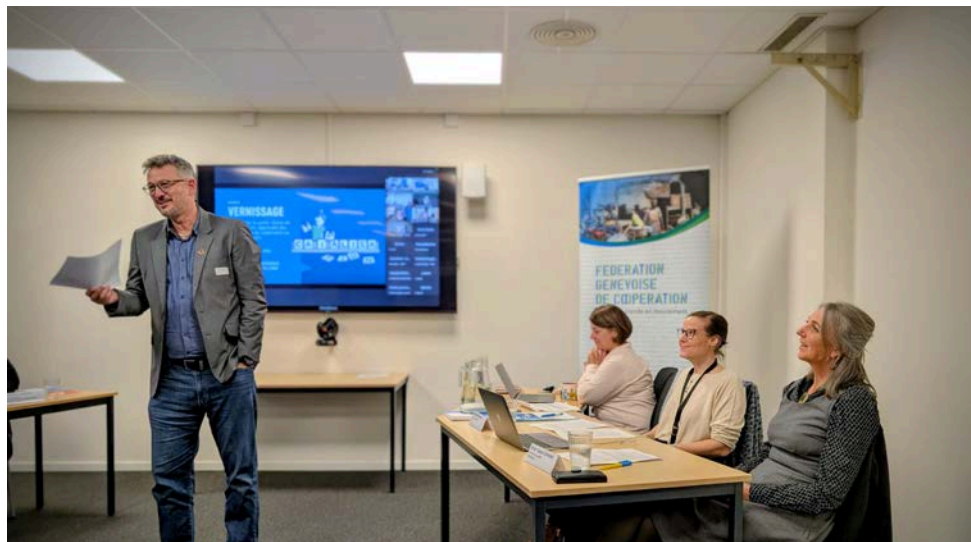
Soirée de lancement à la FGC, le 20.11.2025.