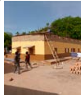
L'ancienne maternité rénoverée et transformée en laboratoire d'analyses.

Les objectifs indiqués soit 3000 analyses sur 1 année sont d'ores et déjà atteints Salle utilisable aussi comme lieu de réunion. En complément, un analyseur biochimique a été installé pour des analyses concernant les fonctions rénales et hépatiques (testes de la créatinine et des transaminases). La plus-value est prise en charge par les Bernardines.