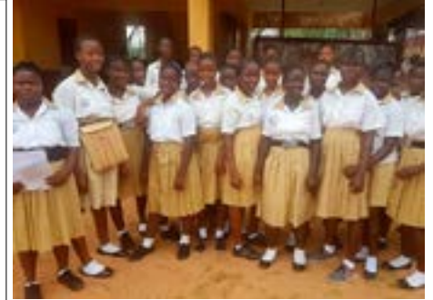
Les élèves de l'école secondaire de Mathora.