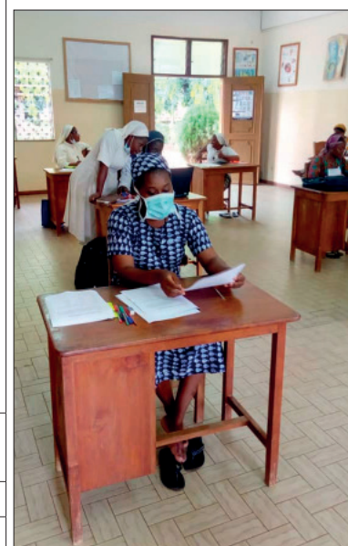
Salle de classe Ecole d'infirmières Hôpital Afagnan