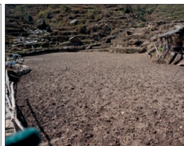
Emplacement du futur jardin modèle