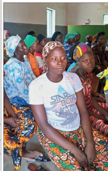
Ancienne maternité : salle d'attente pour la consultation située derrière le paravent au fond.