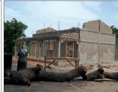
Type de construction envisagé.