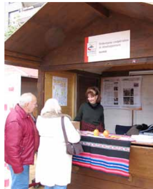
Le « chalet » du Fédéréseau au Village de la francophonie

les communes et les cantons s'engagent en faveur de la coopération internationale, plus la Confédération met de moyens à disposition des associations membres des fédérations.