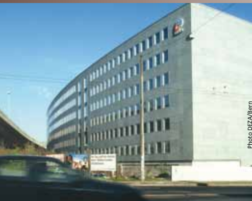
Valais Solidaire, fondée au printemps 2000, est soutenue financièrement depuis 2002 par la Confédération.