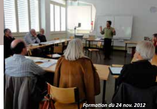
Formation du 24 nov. 2012

Durant la deuxième partie de l'année 2012, le comité a planché sur la création d'une instance chargée d'analyser les rapports financiers remis avec les rapports intermédiaires et finaux envoyés par les associations membres conduisant un projet soutenu par la fédération. Cela s'est fait conformément aux statuts de Valais Solidaire qui mentionne déjà cette commission, sous le nom de «Commission de contrôle financier». (CF). Celle-ci agira en étroite collaboration avec la Commission technique (CT) et décortiquera les charges et dépenses des associations